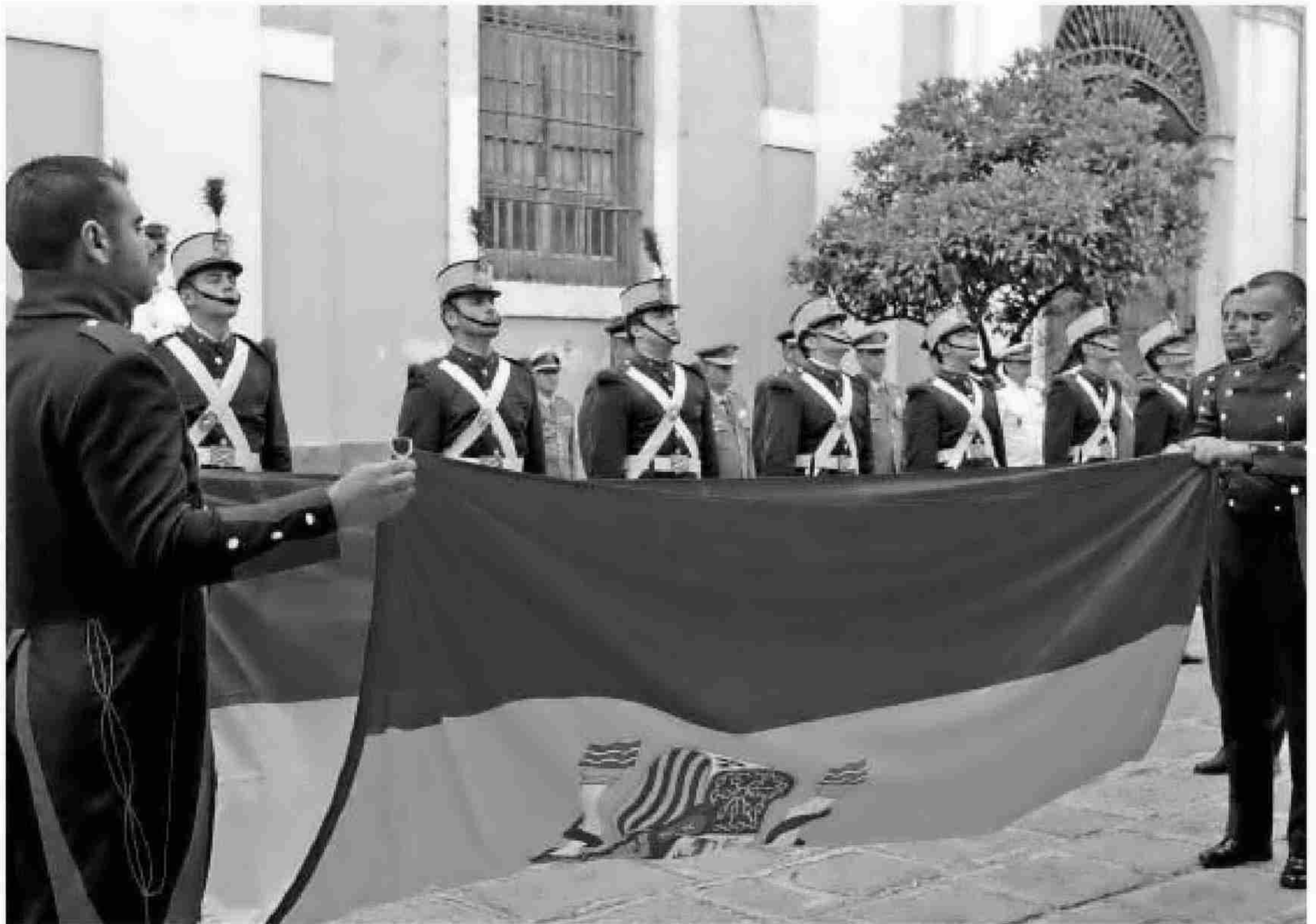
Soldados proceden al plegado de la bandera una vez que fue arriada del mástil de la Fábrica de Artillería.

Asimismo, la delegada de Cultura indicó que se está estudiando un programa de visitas guiadas para que los ciudadanos puedan conocer el edificio, tanto individualmente como en grupo, con vistas a recoger opiniones para la elaboración de un plan director para el monumento que se redactaría durante el próximo año. "Primero hay que saber lo que