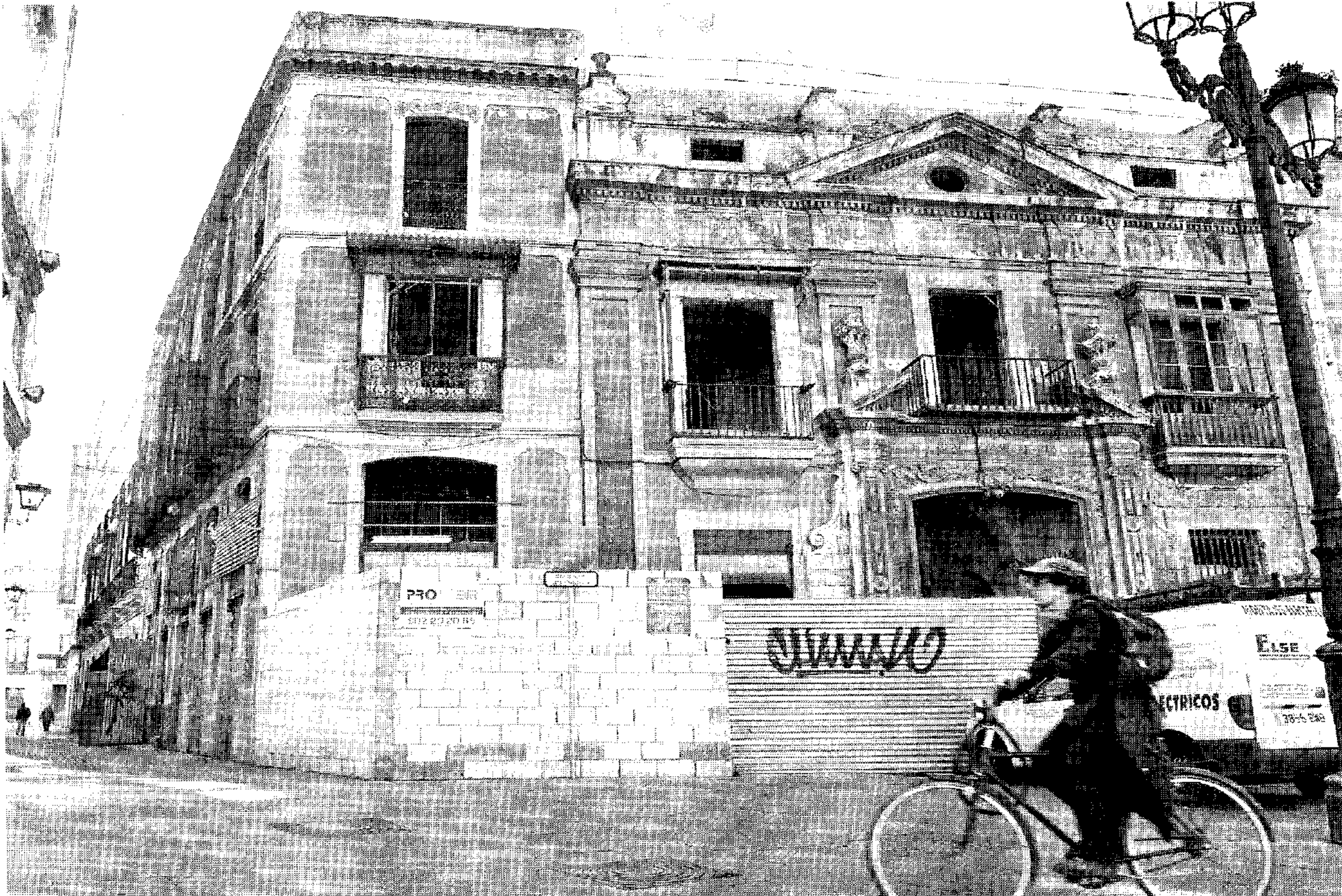
La obras de rehabilitación de la Casa de la Moneda llevan un año paralizadas por Patrimonio.

"El perjuicio que nos están causando es ya insostenible. Económico y a nuestra reputación. Ellos no nos explican cuál es la realidad y no es cierto que haya documentos falsos. Eso es lo que dicen. Lo cierto es que tenemos que demostrar nuestra inocencia, en lugar de que ellos contrasten nuestra culpabilidad", explican los promotores. Desde la paralización de la obra tienen que hacer frente a los costes financieros, que rondan ya los 500.000 euros, además de a todo lo invertido en los trabajos y lo que tendrán que afrontar cuando se retome la intervención: "Había una tela asfáltica que se ha perdido ya, columnas que estaban en una situación complicada. Lo que pedimos es que se decrete la paralización parcial para que podamos actuar sobre estos elementos e impedir que el daño sea mayor".