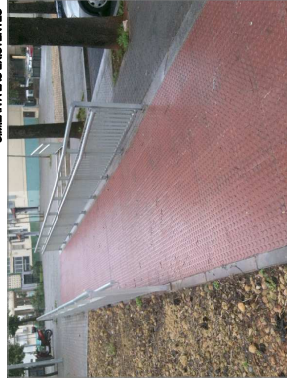
BARANDILLAS EXISTENTES EN LA ZONA